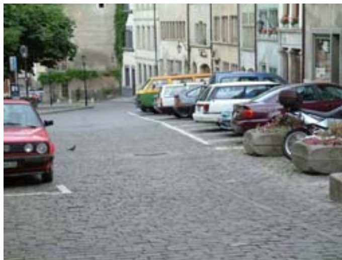
Parcage sur la Samaritaine, encombrant toute la place du «Tanzstat»

Actuellement, les places de parc occupent la plus grande partie des espaces publics. Afin de répondre aux craintes d'un manque, 65 places supplémentaires provisoires de stationnement ont été rajoutées à l'intérieur du quartier pour l'introduction de la vignette habitant et des horodateurs. Cette réalisation de la première étape du projet visé par l'AIA a pu résoudre d'une manière satisfaisante le problème de parcage. Il en résulte même un excédent particulièrement perceptible au parking des Augustins qui offre en permanence des places libres ( 50-70 places libres ont été régulièrement observées), un peu moins les week-ends, mais il reste toujours le parking d'appoint de l'école des Neigles (60 places). Ce constat réjouissant devra encore être affiné, mais offre déjà la perspective pouvoir libérer la place du Petit Saint-Jean (17 places) pour répondre à la deuxième étape du projet de l'AIA, soit la mise en valeur des principales places du quartier. Le suivi de la situation permettra certainement de libérer encore d'autres zones.