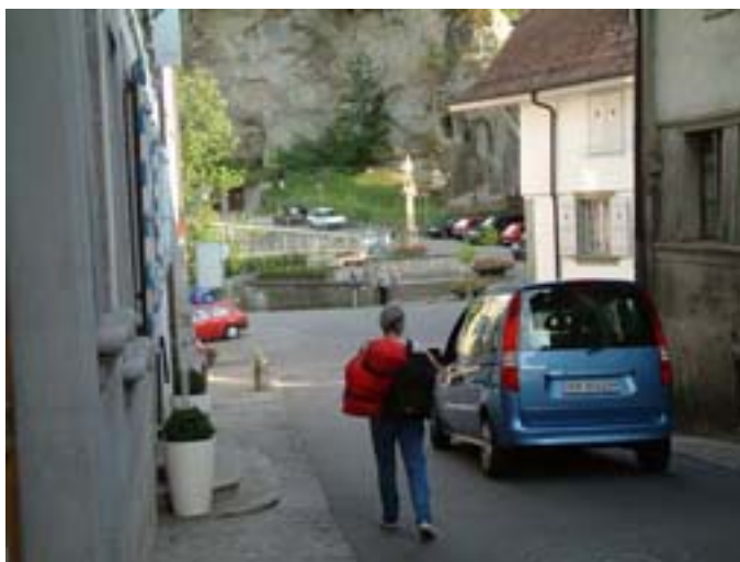
Rue des Forgerons, coin de l'Ange : Exemple d'une situation potentiellement dangereuse

Ces risques concernent les usagers les plus vulnérables, soit les enfants, les personnes âgées et les deux roues. La configuration du quartier invite les piétons, que ce soient les habitants ou les visiteurs, à la flânerie, ce que renforcent encore les terrasses des établissements publics créant de fait un véritable espace de rencontre sur les principales places du quartier. Avec le régime actuel, zone 30 Km/h, qui reconnaît la priorité aux voitures, cette convivialité des espaces publics risque d'être fortement mise à mal par une augmentation du trafic motorisé. Ce sont donc ces constatations qui ont poussé l'AIA à formuler cette demande de réaliser une zone de rencontre .